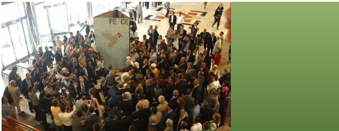
Congrès International Féminin pour une Culture de Paix, Oran (Algérie), 2014