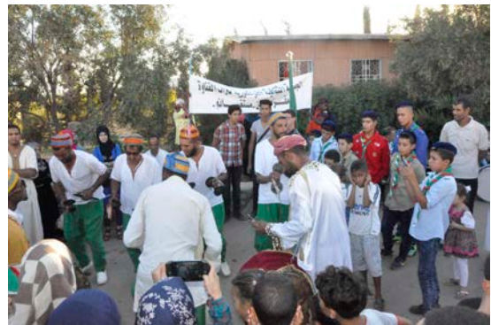
Musiciens accueillant les invités.