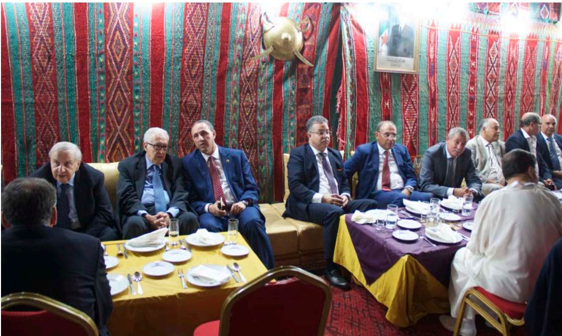
Dîner de clôture sous la tente bédouine (Khayma)