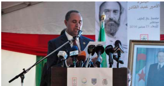
Discours de Monsieur Azzedine Mihoubi, Ministre de la Culture