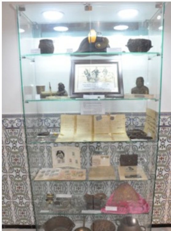
Vitrine d'objets ayant appartenu à l'Emir Abd el-Kader.

A partir de 15h le ballet des véhicules officiels arrivant au siège de la fondation va se poursuivre pendant plus d'une heure. Avant de rejoindre leur place sous les chapiteaux qui sont déjà remplis d'un très nombreux public, les personnalités sont conviés à la visite du patio du bâtiment principal où l'on découvre les oriflammes des voies soufies de la région de Mostaganem ainsi qu'une exposition des objets ayant appartenu à l'Emir Abd el-Kader. La visite est commentée par le cheikh