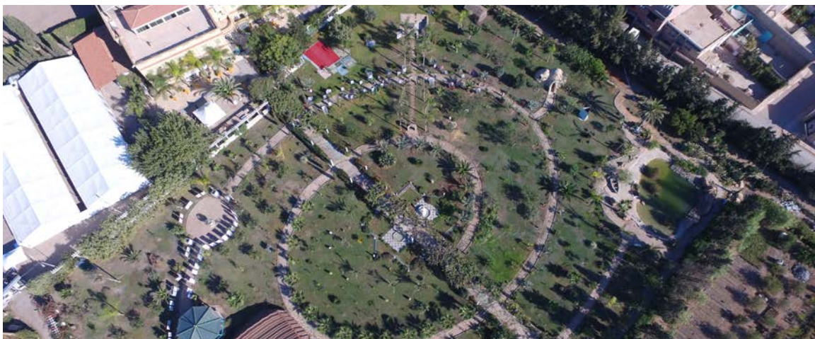
Vue aérienne de la Fondation Djanatu Al Arif, lieu de l'évènement

Deux grands chapiteaux de plus 1000 places sont installés et équipés d'une scène avec un écran géant pour les projections. La plus grande partie est munie de chaises pour les convives tandis que la partie à droite de la scène est recouverte de tapis destinés aux tolbas qui réciteront le coran pour un hommage spirituel à l'Emir. Une grande tente bédouine (Khayma) est installée dans le jardin afin d'accueillir les personnalités durant le dîner.