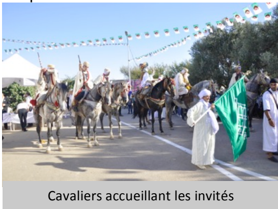
Cavaliers accueillant les invités

Cette atmosphère accompagnera les présents tout au long de l'après midi jusqu'au repas du soir partagé entre amis ou en famille sur le gazon.