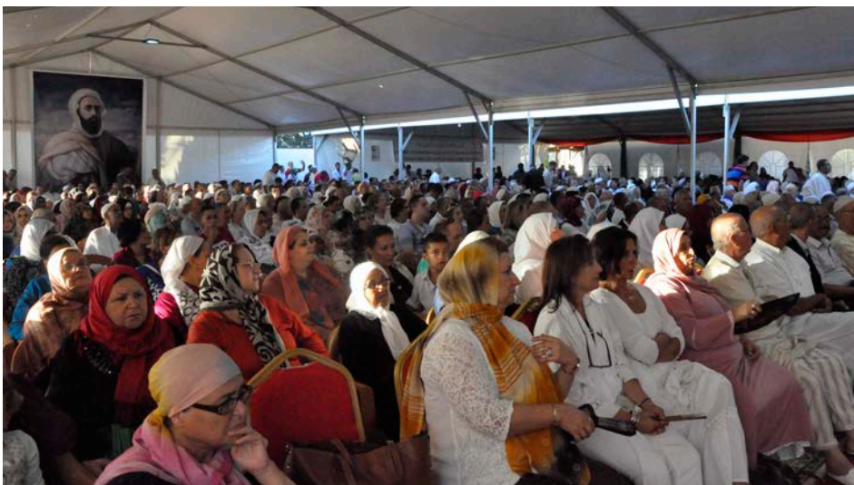
Un public nombreux et attentif