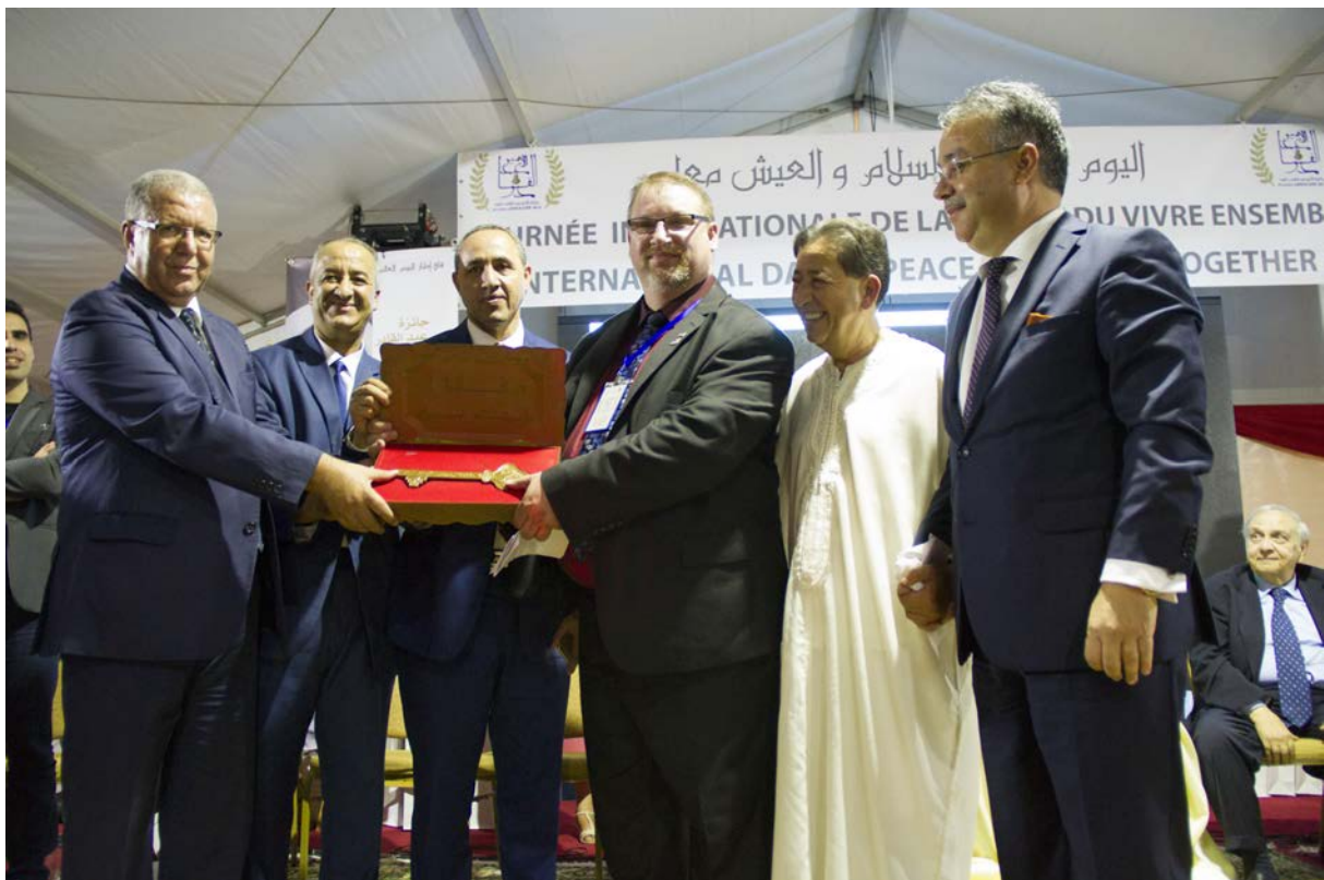
Mr J.R Pope maire de la ville d'El-Kader (USA) reçoit la clé de la ville de Mostaganem des mains du maire de Mostaganem.

la clé de la ville de Mostaganem à M. Pope qui nous a dit qu'elle sera exposée dans son bureau de la mairie de la ville.