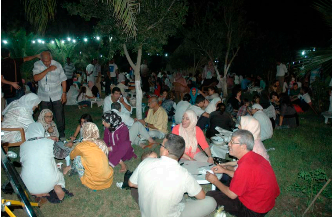
Dîner partagé sur le gazon du jardin de la fondation Djanatu al-Arif

L'ensemble des présents est ensuite invité à partager un repas dans une atmosphère de joie fraternelle à même le gazon. Les personnalités invitées se retrouvent sous la grande tente bédouine (Khayma) pour un dîner traditionnel.