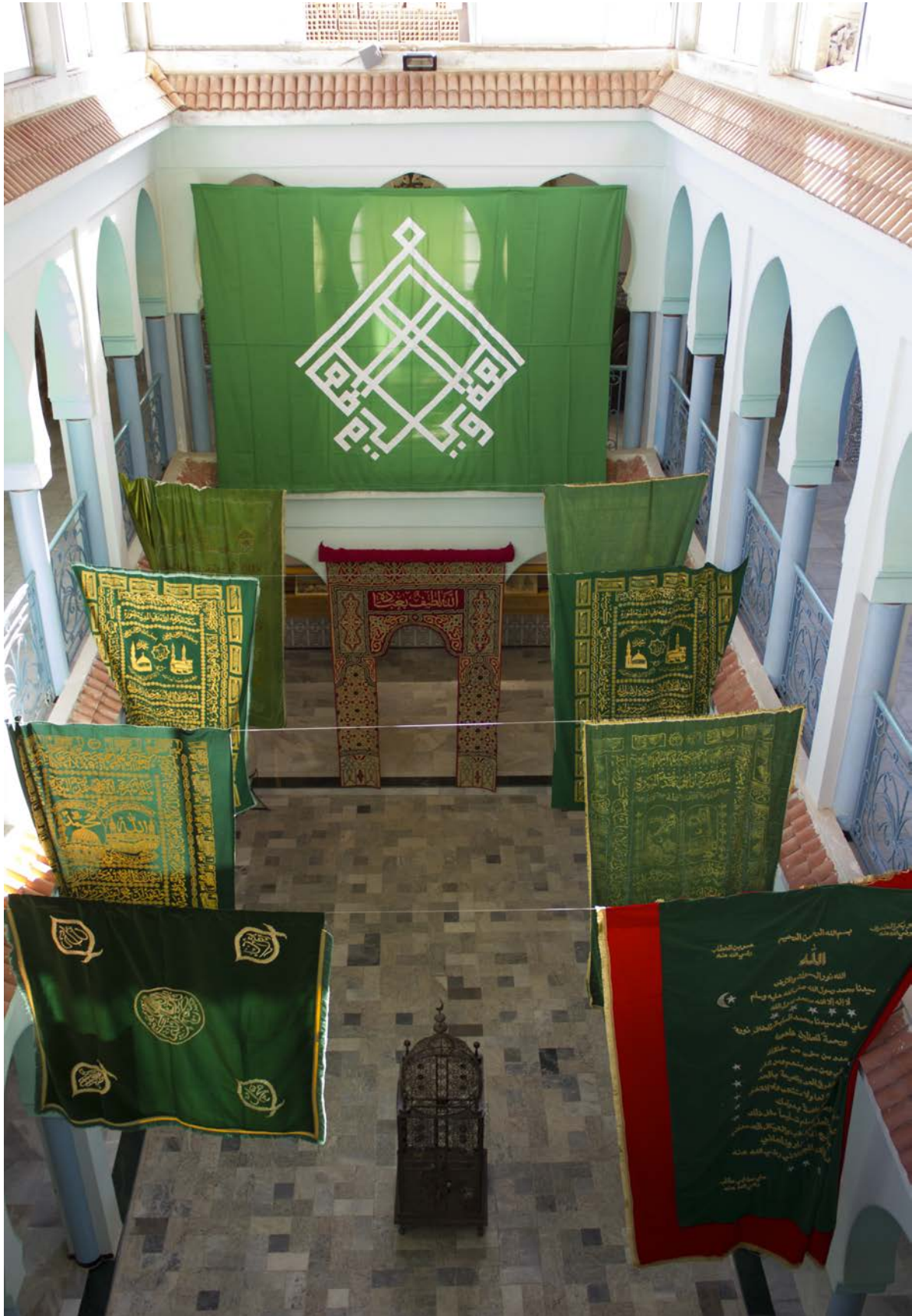
Oriflammes des voies soufies de la région de Mostaganem dans le patio de la fondation